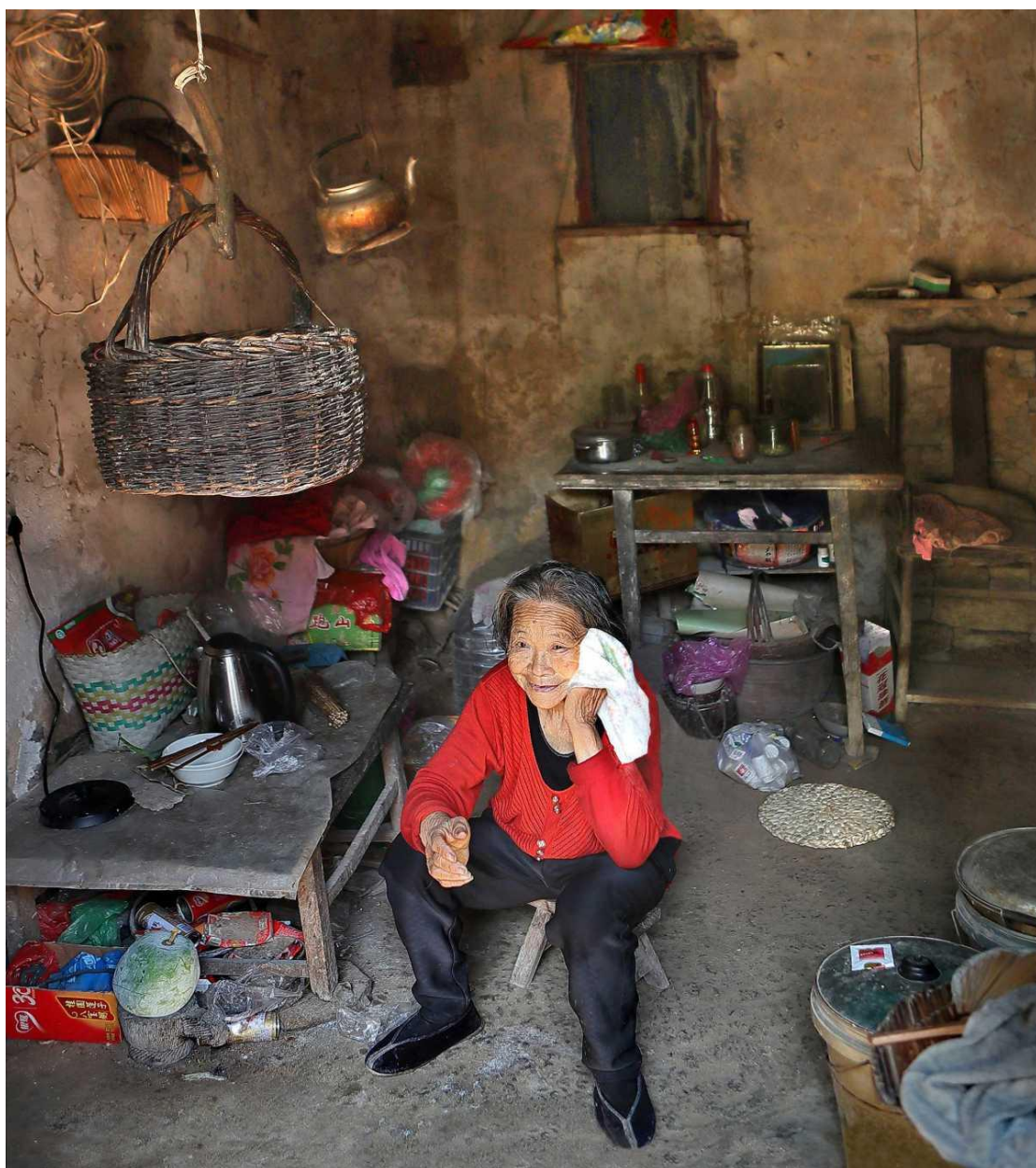
用手帕遮嘴脸是女人常见姿态。

姑娘们使用手帕更是花样百出，有时把手帕盘在头顶，有时用手帕系住脖子后面的散发，有时又把手帕