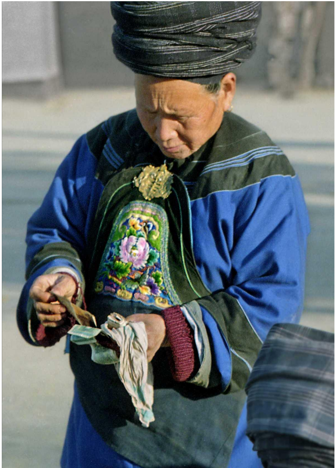
老婆婆打开手帕拿出钱来。