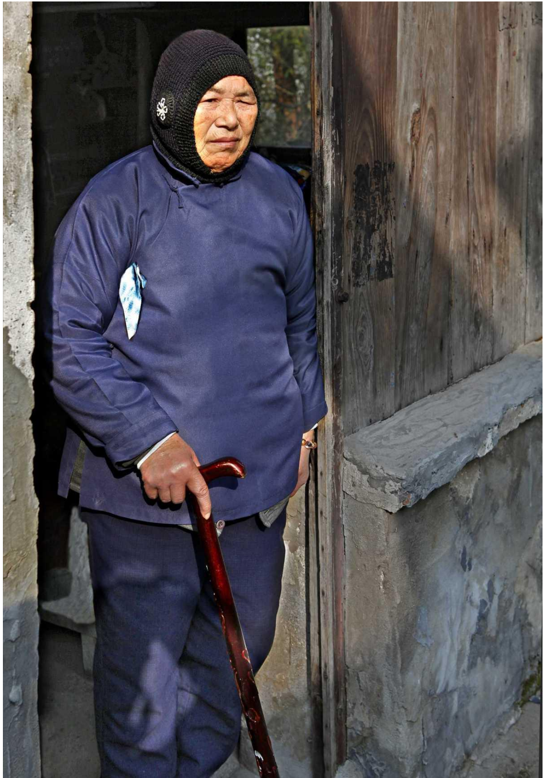
插在斜襟转角下的手帕。