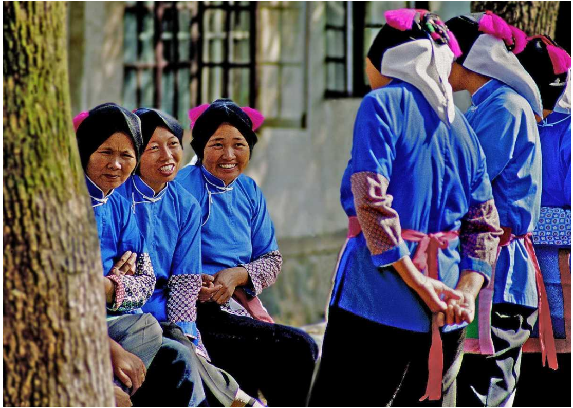
苏南地区妇女系在头上的方帕。

儿时，老师常组织我们玩“丢手帕”，这个传统民间儿童游戏简单有趣、适用性广，因为那时每人都随身带着一条手帕。